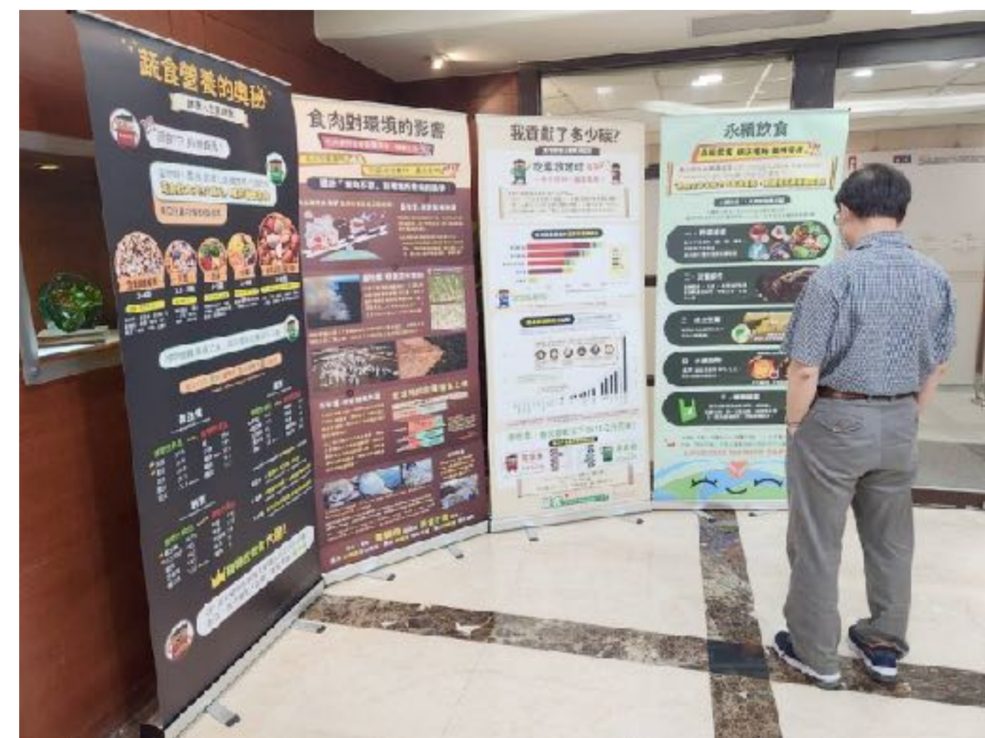
永續知識立牌放在川堂或活動中心 永續環境教育 永續生活引入校園